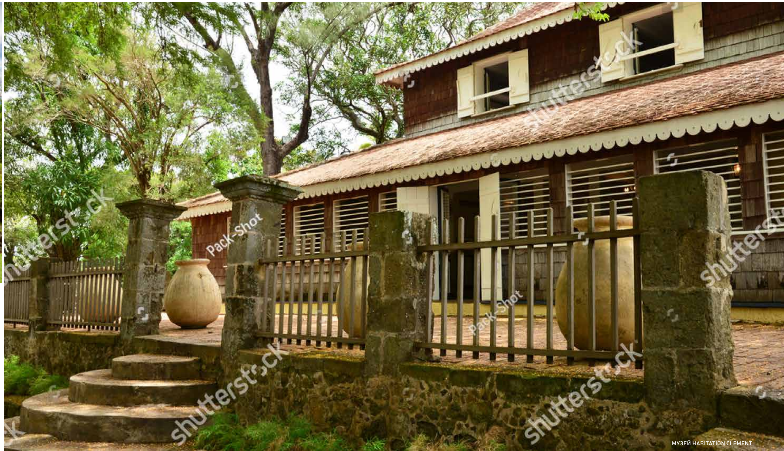
МУЗЕЙ HABITATION CLEMENT