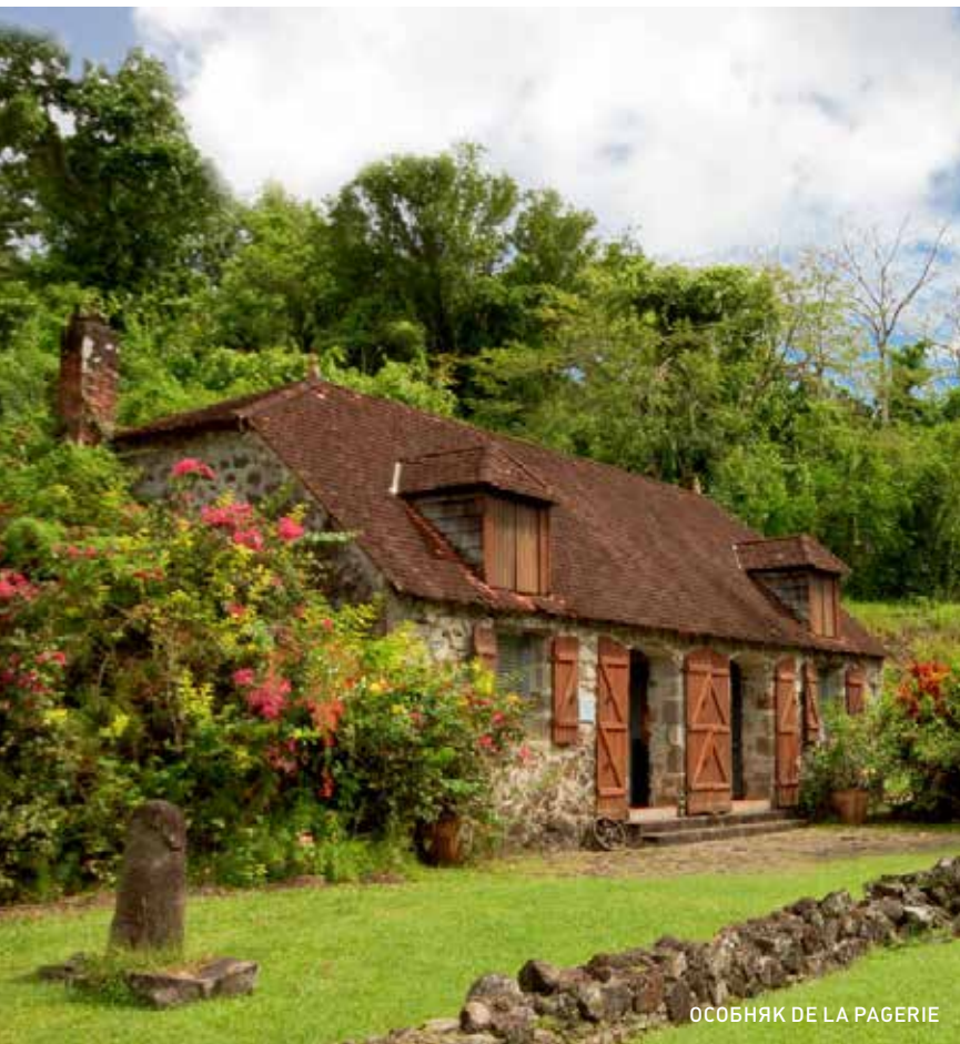
ОСОБНЯК DE LA PAGERIE