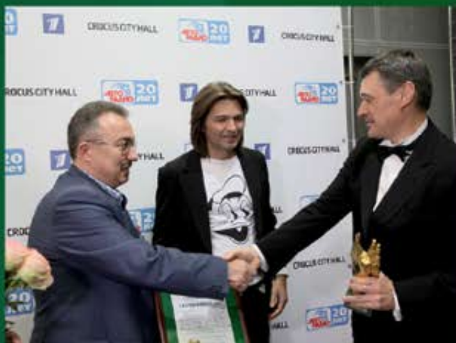
23.06.2013 Крокус Сити Холл, 20-летие Авторадио