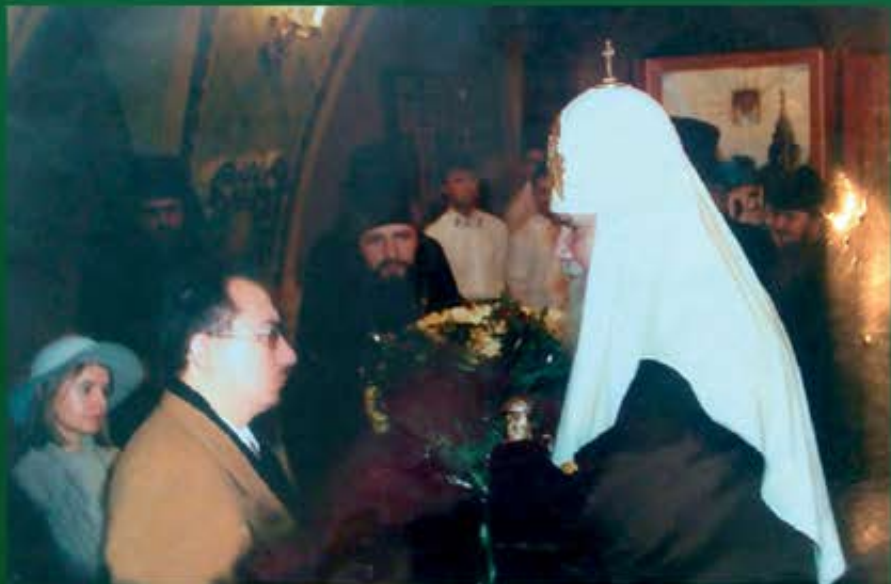
30 ноября 1998 г. Храм Св. Григория Неокесарийского. Москва, ул. Большая Полянка, дом 29а