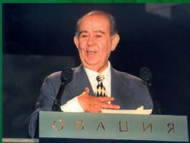
4-ая церемония Малый театр 23.05.1996