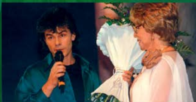
Олег Газманов и Гелена Великанова на "Площади звезд в Москве"