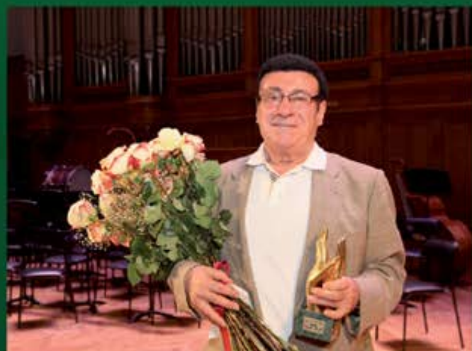
26.05.2012 БЗК, 75-летие Зураба Соткилавы