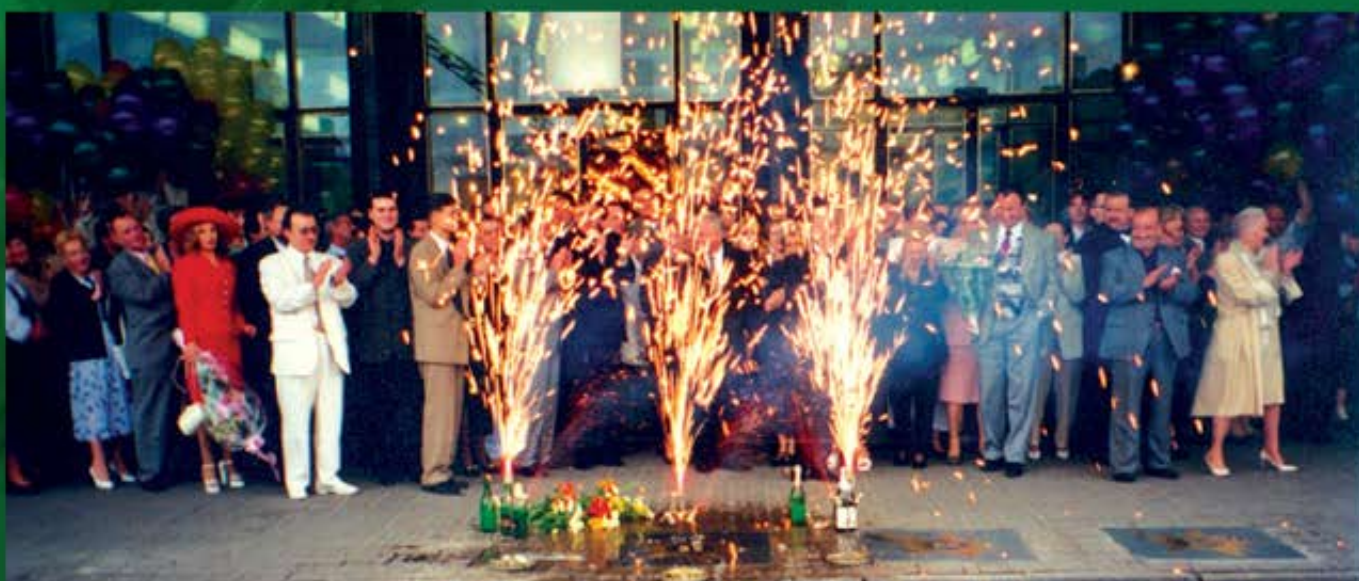
"Площадь звезд в Москве", центральная площадь у ГЦКЗ "Россия"

Премия «ОВАЦИЯ» организовала шоу-программы, посвященные открытию звезд Юрия Антонова, Ирины Понаровской, Шоу Бари Алибасова «НА-НА», Бориса Краснова, Бориса Брунова, Гелены Великановой, Махмуда Эсамбаева, Николая Сличенко и многих других.