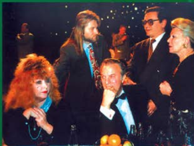
1-ая церемония ГЦКЗ "Россия" 13-14.01.1992

За период с 1992-го по 2014 год статуэтки «ОВАЦИЯ» были вручены более чем 500 лучшим деятелям искусства, а организаторы премии реализовали более ста проектов, внесших заметный вклад в музыкальную жизнь страны.