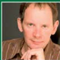
ДАНИИЛ СПИВАКОВСКИЙ заслуженный артист России

Премия «ОВАЦИЯ» имеет свою историю, свой творческий путь, и замечательно, что сейчас она выходит на новый виток развития. Это большое культурное событие, такой культурный перформанс. Прекрасно, что существует премия, объединяющая всю музыку, включая музыку театра и кино.