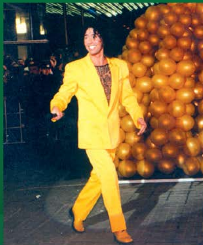
Открытие именной звезды Валерия Леонтьева на "Площади звезд в Москве"