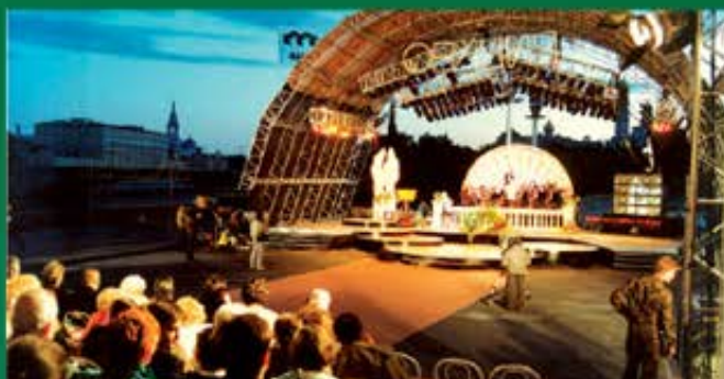
11-12.06.1993, площадь у ГЦКЗ "Россия". Открытие "Площади звезд в Москве"